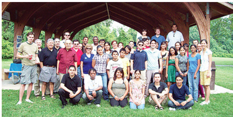
Fundación Esperanza entregó un total de seis becas. En la foto los estudiantes beneficiados celebran con familiares y miembros de la organización.

Una organización sin fines de lucro, recientemente fundada por jóvenes empresarios y profesionales del área metropolitana hace honor a su nombre. La Fundación de